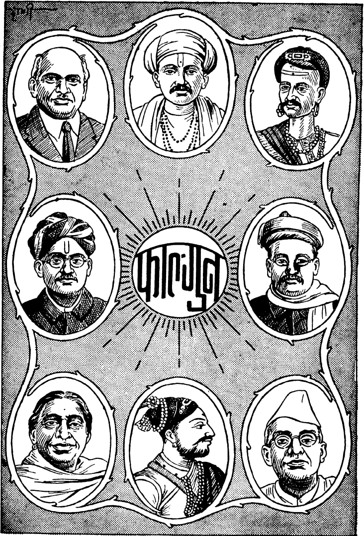
श्री. व्यं. केतकर, श्रीसंत तुकाराम, नाना फडणीस, हरिभाऊ आपटे. ना. गो. कृ. गोखले, सरोजिनी नायडू, छत्रपति संभाजी, शरच्चंद्र बोस.